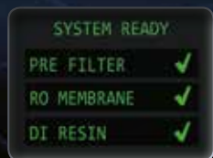
ПРОВЕРКА ПРИ ЗАПУСКЕ