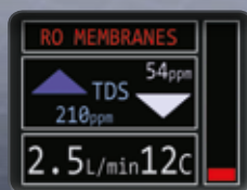
"КРАСНый" РЕЖИМ РАБОТЫ