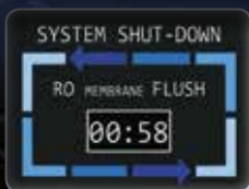
ПРОМЫВКА ПРИ ЗАВЕРШЕНИИ РАБОТЫ