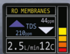
"ЖЕЛТый" РЕЖИМ РАБОТЫ